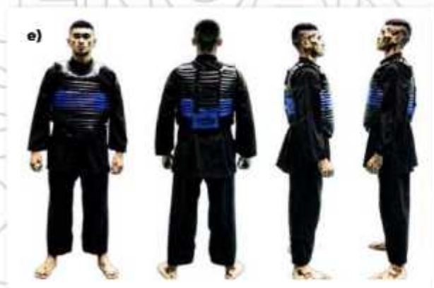
e) ATLET TANDING SUDUT BIRU