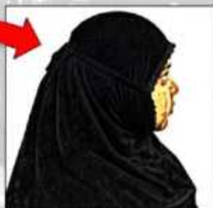
ATLET PUTRI BERHIJAB