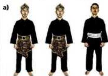
a) ATLET TGR PUTRA