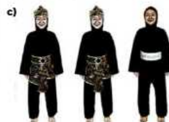
c) ATLET TGR PUTRI BERHIJAB