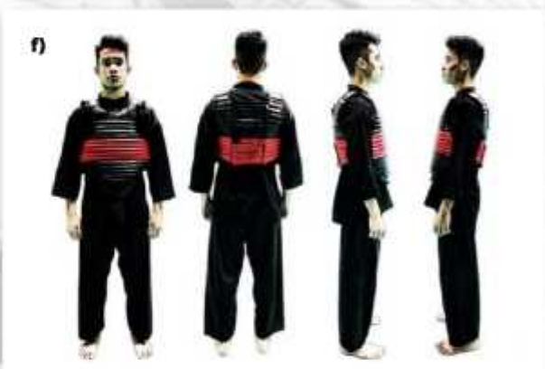
f) ATLET TANDING SUDUT MERAH