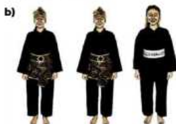
b) ATLET TGR PUTRI