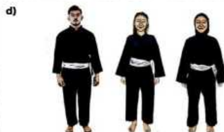
d) ATLET SENI BEREKU